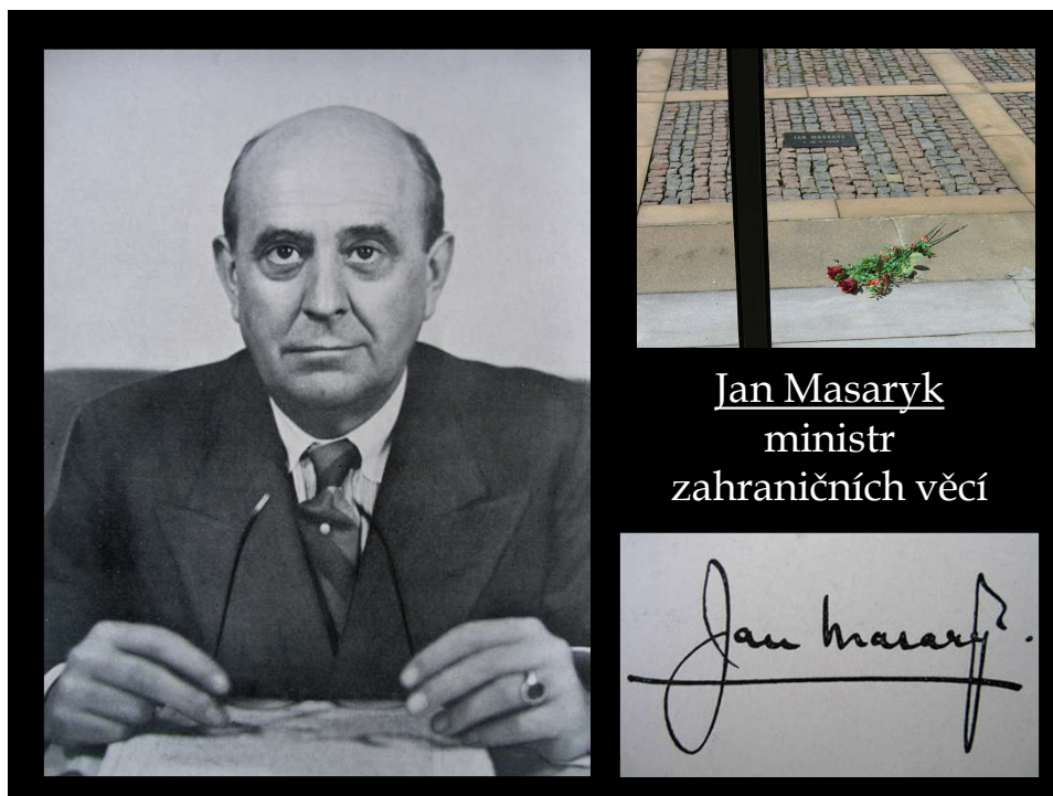
Jan Masaryk ministr zahraničních věcí