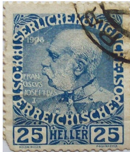
Poštovní známka z roku 1908 s portrétem Františka Josefa I.