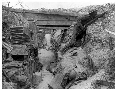
Vojáci Dohody v zákopu