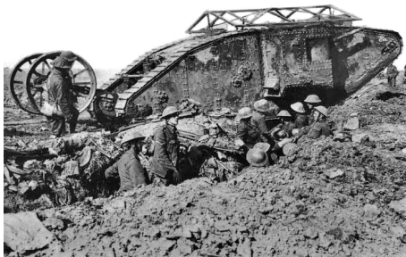
Britský tank Mark I